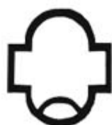
Схема расположения выводов