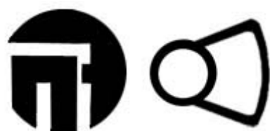
Схема расположения выводов