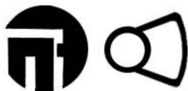
Схема расположения выводов