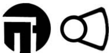
Схема расположения выводов