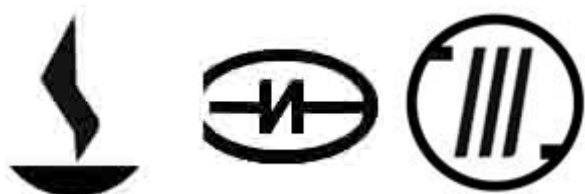
Схема расположения выводов