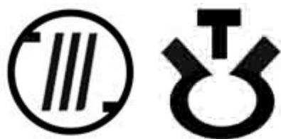
Схема расположения выводов