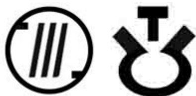
Схема расположения выводов