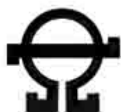
Схема расположения выводов