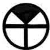
Схема расположения выводов