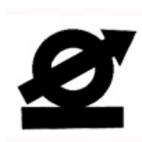
Схема расположения выводов