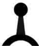
Схема расположения выводов