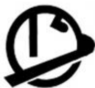
Схема расположения выводов