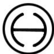
Схема расположения выводов