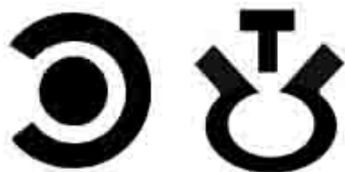
Схема расположения и назначение выводов